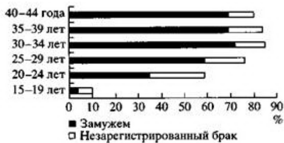
Рис. 1. Вид совместного проживания (в % от числа опрошенных)

ского и репродуктивного здоровья женщин фертильного возраста, сокращение случаев потерь плодов и детей, обеспечение условий для рождения, а затем воспитания физически и психически здорового молодого поколения*. Анализируя уровень рождаемости, аборт, заболеваемости, нетрудно сделать вывод, что почти каждый регион России нуждается не просто в стабилизации и росте численности населения, а в создании условий для оздоровления демографической ситуации.